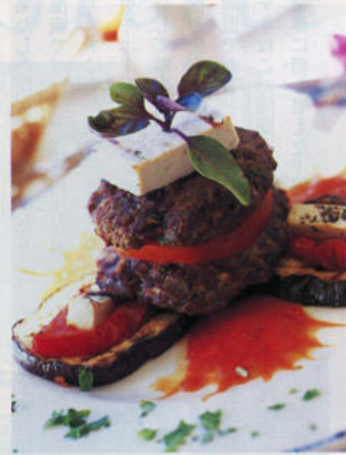
ギリシャ料理定番のナス トマト フェタ(ヤギのチーズ)を使用した焼肉の重ね焼き。

に表わす言葉もある。フィロクセニア―古くはゼウス信仰に発し、それが つの国民性にまでなったという。「ヤサス」やあと声を掛けると、必ず笑顔とともに、「ヤサス」が返ってくる。人との接し方が上手だし、温かみがある。ミコノス島が多くの人を惹きつけるのは、いかにもギリシャらしい佇まいと、どことなく鄙びた感じを与えるせいかもしれない。最後に訪れたサントリーニ島は、火山の大爆発でその中心部が没し、カルデラの海ができた時、その海を抱えるようにして残った外輪山の つである。この爆発が起きたのは紀元前七世紀後半、人類の