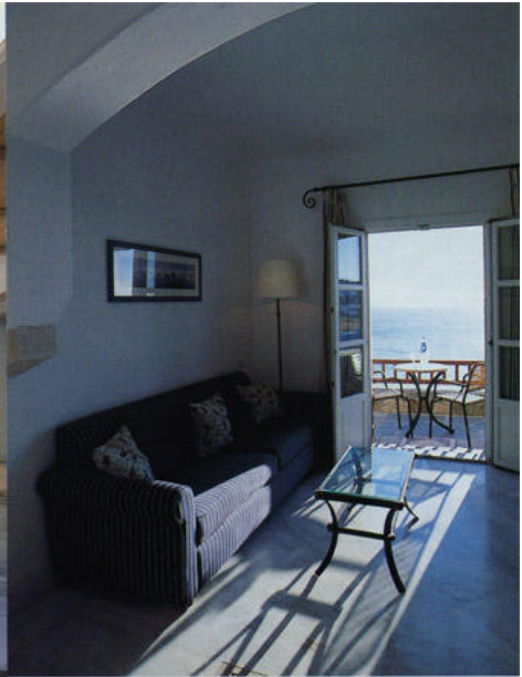
右 各部屋のバルコニーからデロス島を眺めることができるミコノス グランドホテル&リゾート。 左 ロビーのフロアはデロス島の古代住宅遺跡から見つかったモザイクをイメージしている。